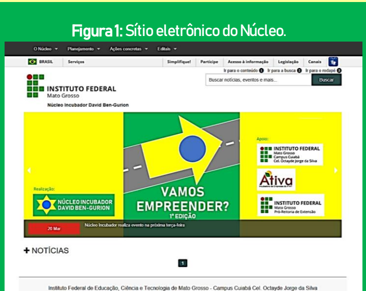
Figura 1: Sítio eletrônico do Núcleo.