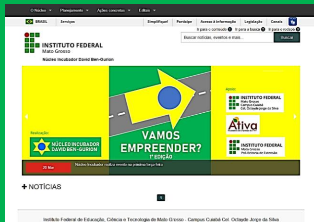
Figura 1: Sítio eletrônico do Núcleo.